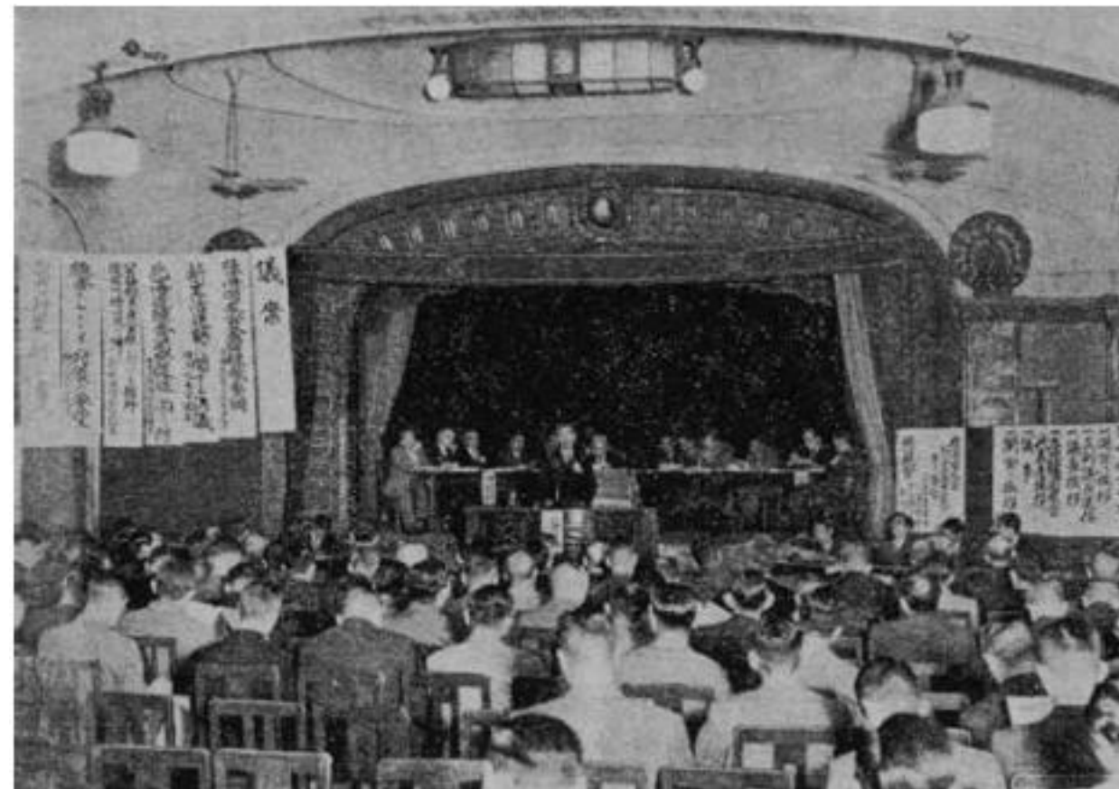
経済同友会第四回全国大会（1951年11月9日）

本会は他面、会員が相互に啓発し合い切磋琢磨する教室でもあり、また気楽に親交を温める倶楽部でもある。