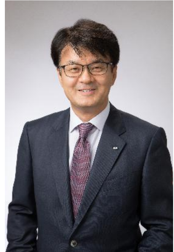
経済同友会代表幹事 山口 明夫