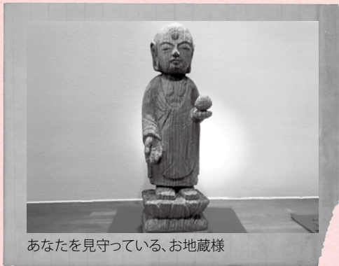
あなたを見守っている、お地藏様